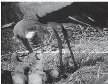
Bild über die Livekamera